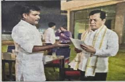
పారిశ్రామిక అభివృద్ధి పనుల గురించి కేంద్రమంత్రి శర్మానందకు వివరిస్తున్న రాష్ట్ర మంత్రి అమర్నాథ్

సాక్షి, విశాఖపట్నం : మహా విశాఖ నగరం.. గ్లోబల్ సిటీగా అభివృద్ధి చెందుతోందని కేంద్ర షిప్పింగ్, పోర్టులు, జలరవాణా శాఖ మంత్రి శర్మానంద సోనోవార్ అన్నారు. అంతర్జాతీయ నగరంగా పరిధివిల్లుతున్న నేపథ్యంలో పర్యాటకంగా వైజాగ్ ను అభివృద్ధి చేసేందుకు ప్రణాళికలు రూపొందిస్తున్నామని తెలిపారు. సోమవారం విశాఖ నగరానికి చేరుకున్న మంత్రి పోర్టులో జరుగుతున్న ప్రాజెక్టుల పనితీరుపై సమీక్ష నిర్వహించారు. అనంతరం మీడియాతో మాట్లాడారు. పర్యాటక రంగంలో కొత్త ఒరవడి సృష్టించేలా త్వరలోనే విశాఖపట్నం నుంచి సీ -క్రూయిజ్ షిప్పింగ్ ప్రారంభిస్తామని తెలిపారు. విశాఖపట్నం పోర్ట్ అథారిటీ వ్యాపార లావాదేవీల్లో చరిత్ర సృష్టిస్తోందన్నారు. ఇండియాలోని పోర్టుల్లో వైజాగ్ బెస్ట్ పోర్ట్ గా మారేందుకు అత్యంత దృఢంగా ఉన్నామని తెలిపారు. అత్యధునిక సదుపాయాలతో విశాఖపట్నం పోర్టుని అంతర్జాతీయ స్థాయిలో తీర్చిదిద్దేందుకు పూర్తి చర్యలు చేపడుతున్నట్లు పేర్కొన్నారు. రూ.40 కోట్లతో వివిధ డిజిటల్ కార్యక్రమాలకు మిగతా 2వ పేజీలో ▶