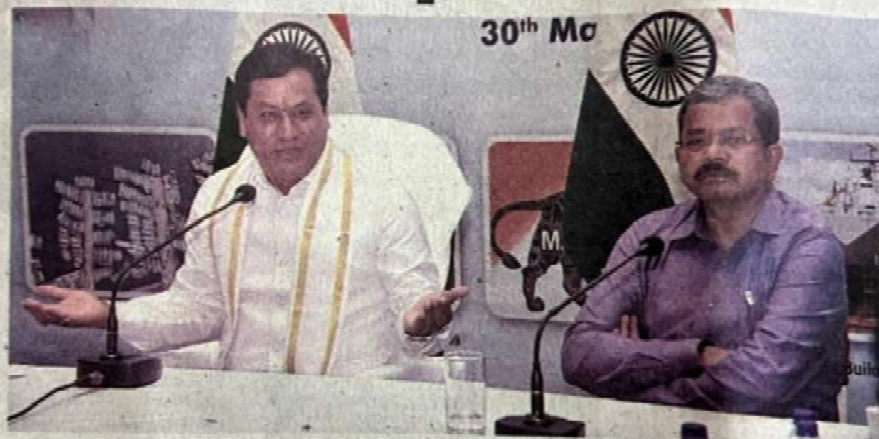
Union Minister Sarbananda Sonowal speaking at a press conference in Visakhapatnam on Monday

The Union Minister reviewed the progress of the projects implemented by the port at a cost of Rs 1,446 crore. Some of them include the OR-1 and OR-2 capacity augmentation project